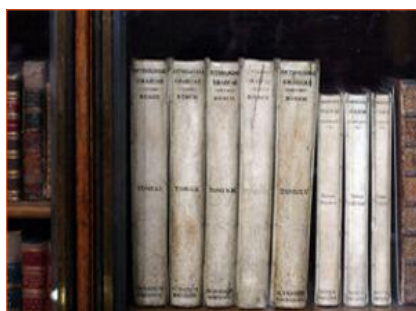
Antología Palatina, British Museum de Londres

En la Antología Palatina o Antología Griega, del siglo V, se recogen más de 40 problemas de ese tipo.